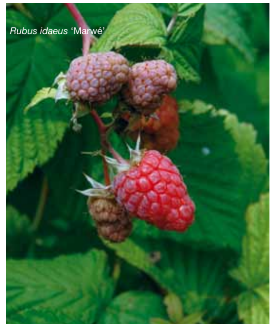
Rubus idaeus 'Marwé'