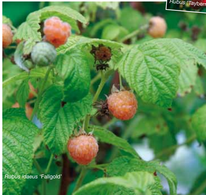
Rubus idaeus 'Fallgold'