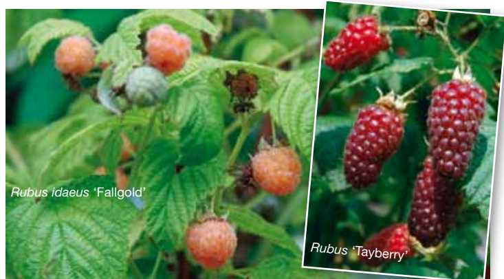
Rubus idaeus 'Fallgold'