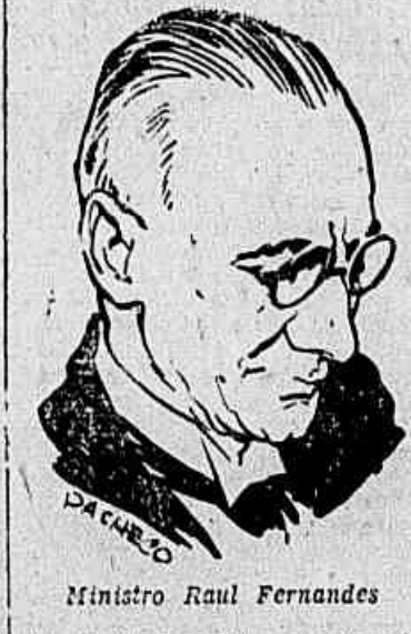
Ministro Raul Fernandes

Foi muito divulgado aquele episódio em que o secretário de Estado, dizendo ao presidente Truman (Conclui na 2.ª pág.)