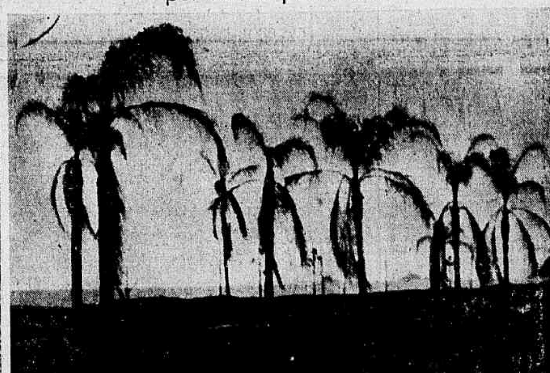
Mostra a gravura alguns dos coqueiros de Ipanema que começam a definhar

Não faz muito tempo publicamos interessante reportagem sobre a plantação de coqueiros na praia de Ipanema. Na ocasião, adiantamos que a inovação mereceu aplausos gerais, pois, além de embelezar ainda mais o aprazível recanto, proporcionaria