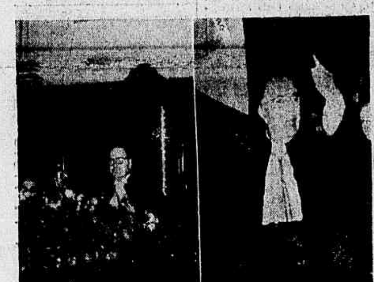
Na imagem, dois aspectos da teoria jurídica do Tribunal de Justiça, quando se despedia o Desembargador Piragibe. Vêem-se o Desembargador Adelmar Tavares, presidente do Tribunal, quando terminava seu discurso de homenagem, e o Desembargador Piragibe quando pronunciava a sua comóvete oração de agradecimento.

Aposentado por ter atingido ao limite de idade, despediu-se ontem do Tribunal de Justiça o Desembargador Vicente Piragibe. Por quase um quarto de século o Desembargador Piragibe presidiu os mais assinalados serviços à Justiça, inclusive no Supremo Tribunal como substituto de ministros. Antes de se incorporar à magistratura, o Desembargador Piragibe muito se distinguiu como advogado, como jornalista e como político, tendo sido representante ilustre do Distrito Federal na Câmara dos Deputados. É, ainda, um espírito eminentemente dedicado às obras sociais, do que é testemunho o Asilo N. S. da Pompéia, sua criação e destinado a prestar assistência aos filhos dos encarcerados.