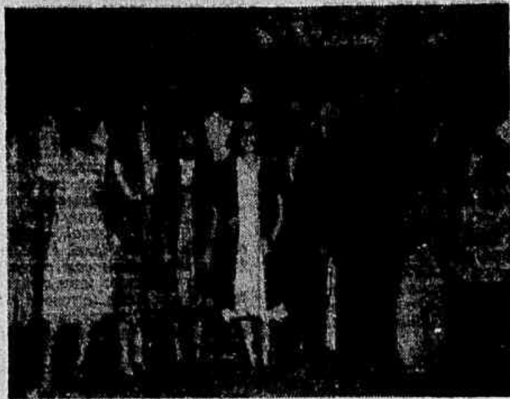
Simpaticantes e dirijentes do querido grêmio do Del-Castillo, posam para nossa objetiva, após o prêmio em que saiu vencedor

Alzando com superioridade, venceu o Nova América o encontro de anteontem — 5 x 0, o escore — Quadro vencedor — Preliminar — Notas