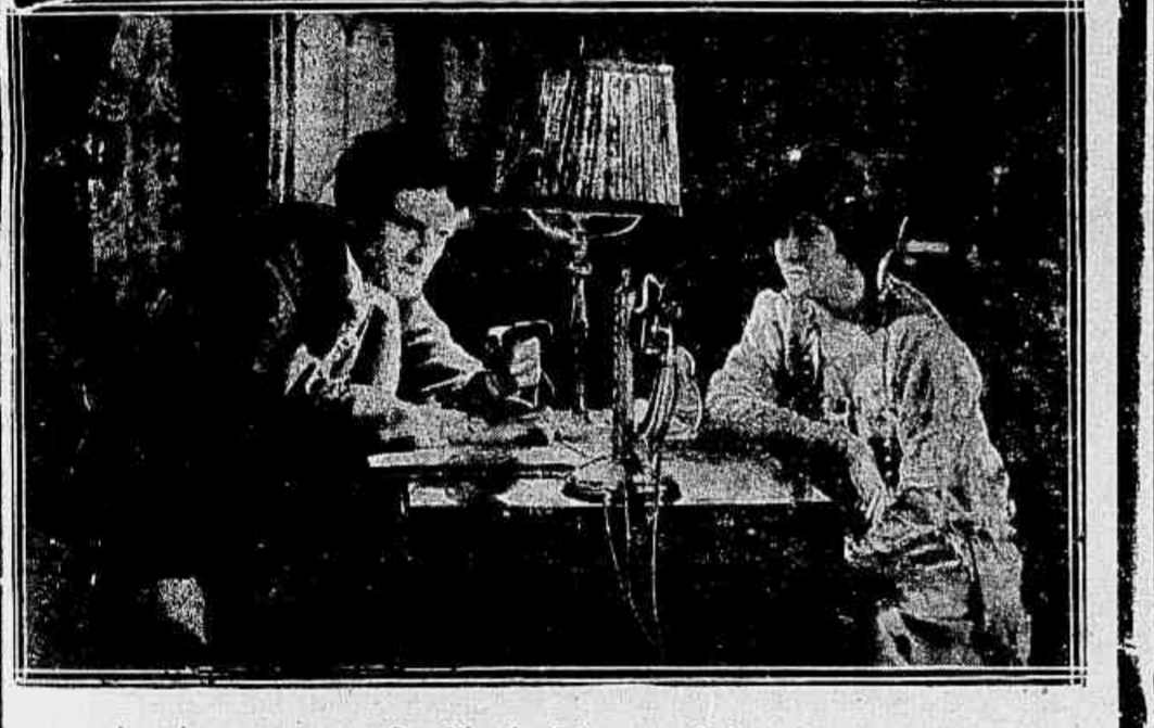
A sentença se cumpre. Seu filho, herdeiro natural de tão terríveis papais, succumbem ás mesmas fatídicas horas. A policia não descobre a causa das duas mortes senão por acaso, que vemos no decorrer do film ??? ? ? 3 actos de 10 Film d'Art.