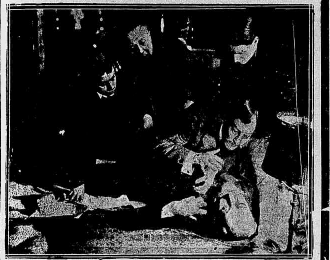
Um magistrado em evidencia, possuidor de documentos comprometedores para um seu collega, é ameaçado de morrer as 10 horas, se não entregar os alludidos documentos.