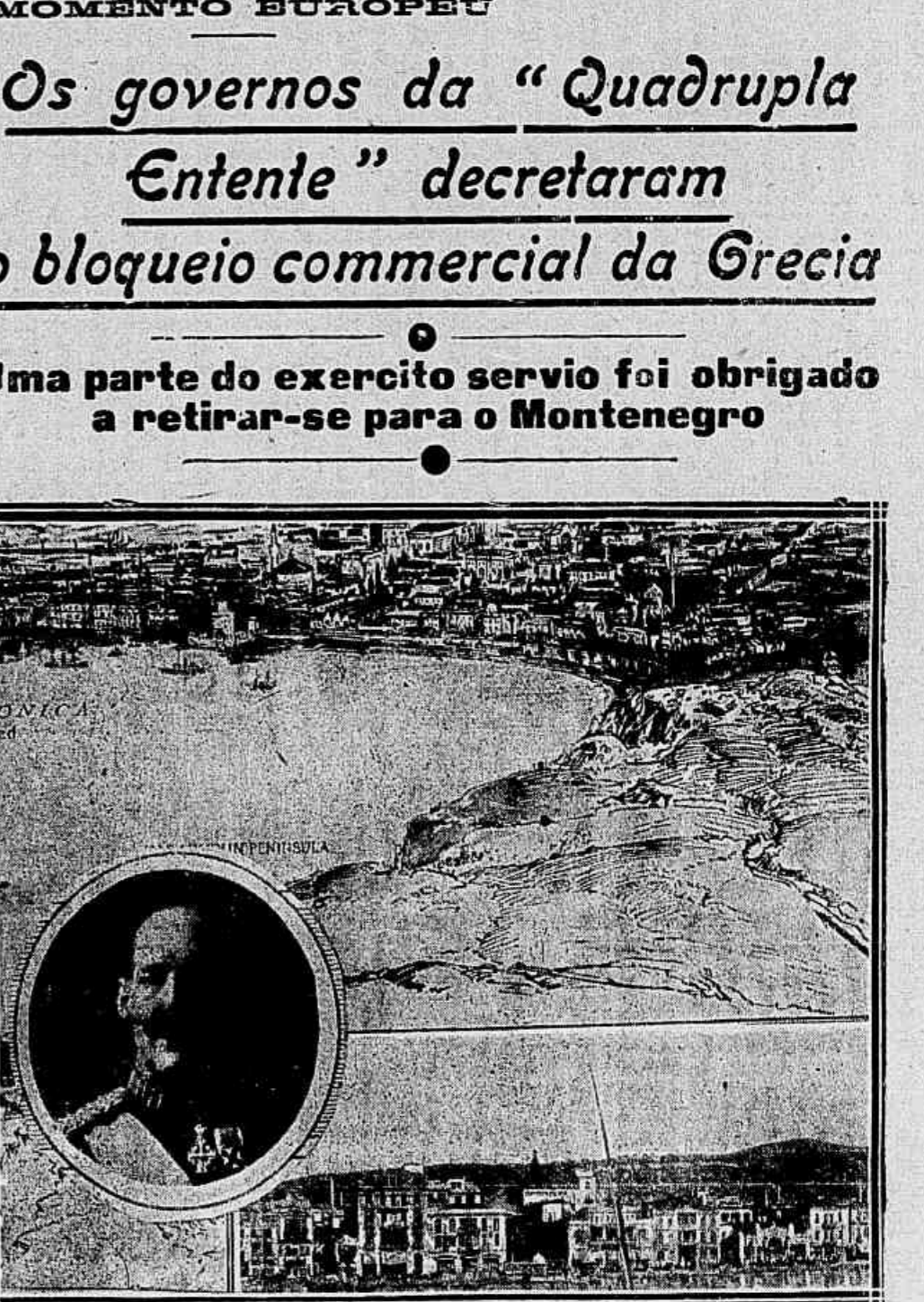
Conforme noticias telegraphicas que vão publicadas mais adiante, as nações que constituem a "Entente" os aliados — acabam de declarar o bloqueio commercial contra a Grecia, esse mesmo tempo que passaram a considerar Salonica territorio alliado, cujo porto, que se vê em parte na gravura, é o ponto que mais lhes convem para o desembarque das suas tropas que se destinam á Servia. Em baixo, uma vista da cidade grega, e no medalhão o rei Constantino da Grecia.