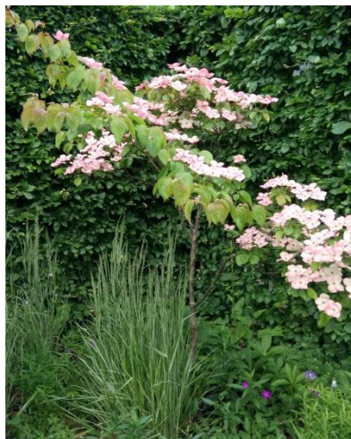
Haven i Vinding

ubrudt drift siden - nu drevet af frivillige i foreningen Børkop Mølles Venner. Desuden så vi også "Farbror Svens samling", som er en stor samling af gamle landbrugs- og husholdningsredskaber i den gamle svinestald.