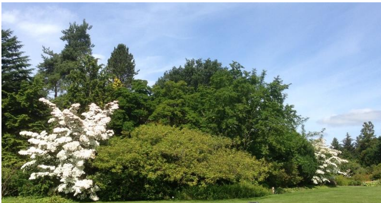
Blå himmel i GH