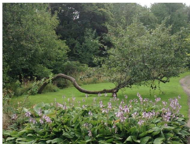
Motiv fra Geografisk Have