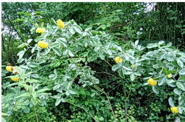
Ananasgyvel (Marokko)

Vi blev budt velkommen af foreningens formand, der mente, at det var et strålende vejr til en haveudflugt - sådan rigtigt havevejr - med lidt vind, nogle regnbyger og ikke for meget sol. Det med regnbygerne holdt stik, men da de fleste var udstyret med både regntøj og gummistøvler, blev det til en rigtig dejlig havetur.