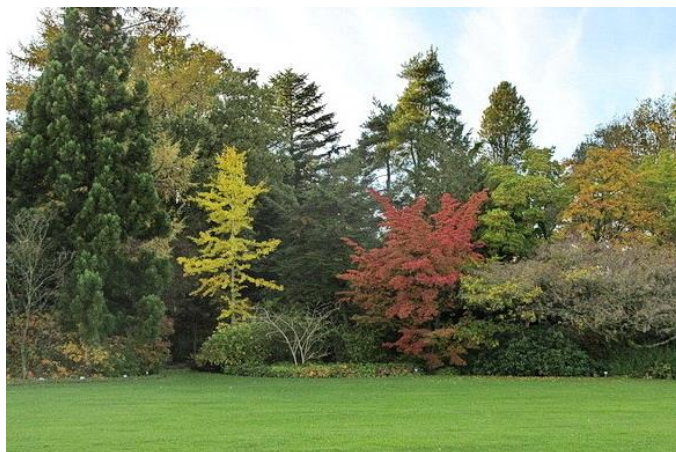
Geografisk Have i høstfarver

Tak for godt samarbejde til GHVs medlemmer, bestyrelse og Havens ansatte.