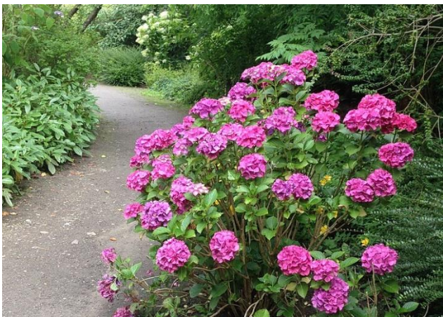
Motiv fra Geografisk Have

En post som næstformand gennem flere år har i en enkelt periode givet mulighed for avancement til formand for bestyrelsen. Hertil må jeg tilføje, at den største indsats for mig har været et meget inspirerende arbejde med salg af studepladser ved foreningens plantemarkeder, der i årenes løb voksede sig fra beskedne kår til "Danmarks smukkeste" og største af sin art.