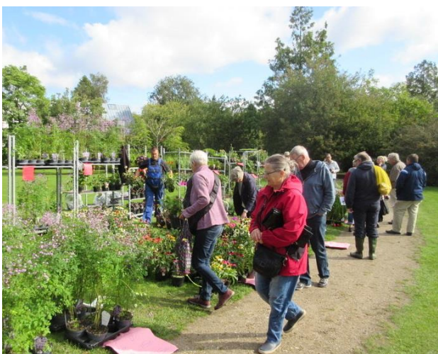
Motiv fra Plantemarked

Et righoldigt område stilles her til rådighed for enhver borger, barn som voksen, lokal som global.