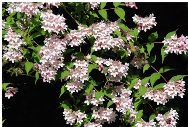
Dronningebusk med overdådig blomstring

Dronningebusken har en helt overdådig blomstring af lange tragt- til klokkeformede lys rosa blomster med gult svælg, ca. 2 cm i diameter. Blomsterne skjuler ofte busken helt i et enormt betagende flor i hele juni måned. Det er ret længe for en busk at blomstre godt 4 uger.