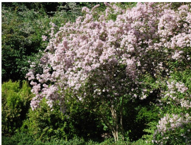
Kolkwitzia i Geografisk Have

Kolkwitzia amabilis er dronningebuskens botaniske navn. Planten er opkaldt efter den tyske professor R. Kolkwitz, og artsnavnet amabilis stammer fra latinske ' amare ', der betyder elske. Denne busk kan man vel kun elske - også selvom den efterhånden kan blive ret stor. Beskrivelserne siger kun 2 - 3 måske 4 meter høj og bred, men den bliver større, når blot den får tid. 5 - 6 meter har jeg ofte oplevet.