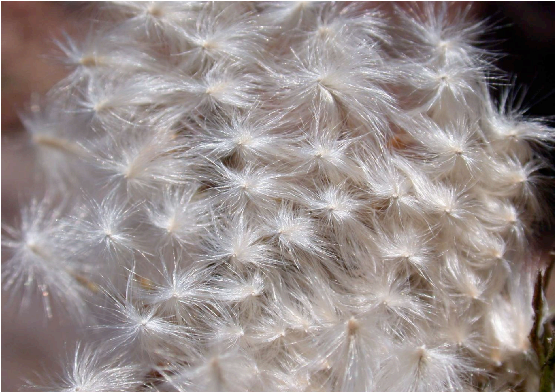
Gazania rigens „Goldgelb“, fruchtend