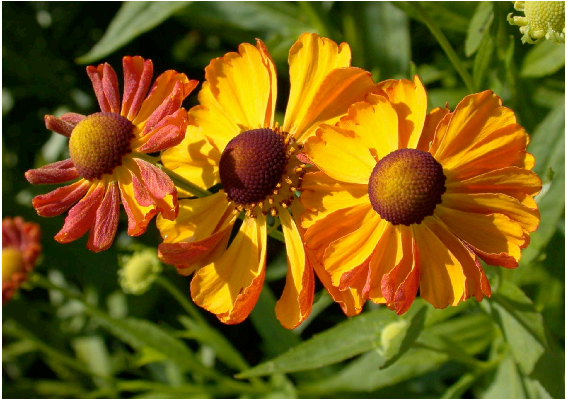
Helenium autumnale „Golddrausch“