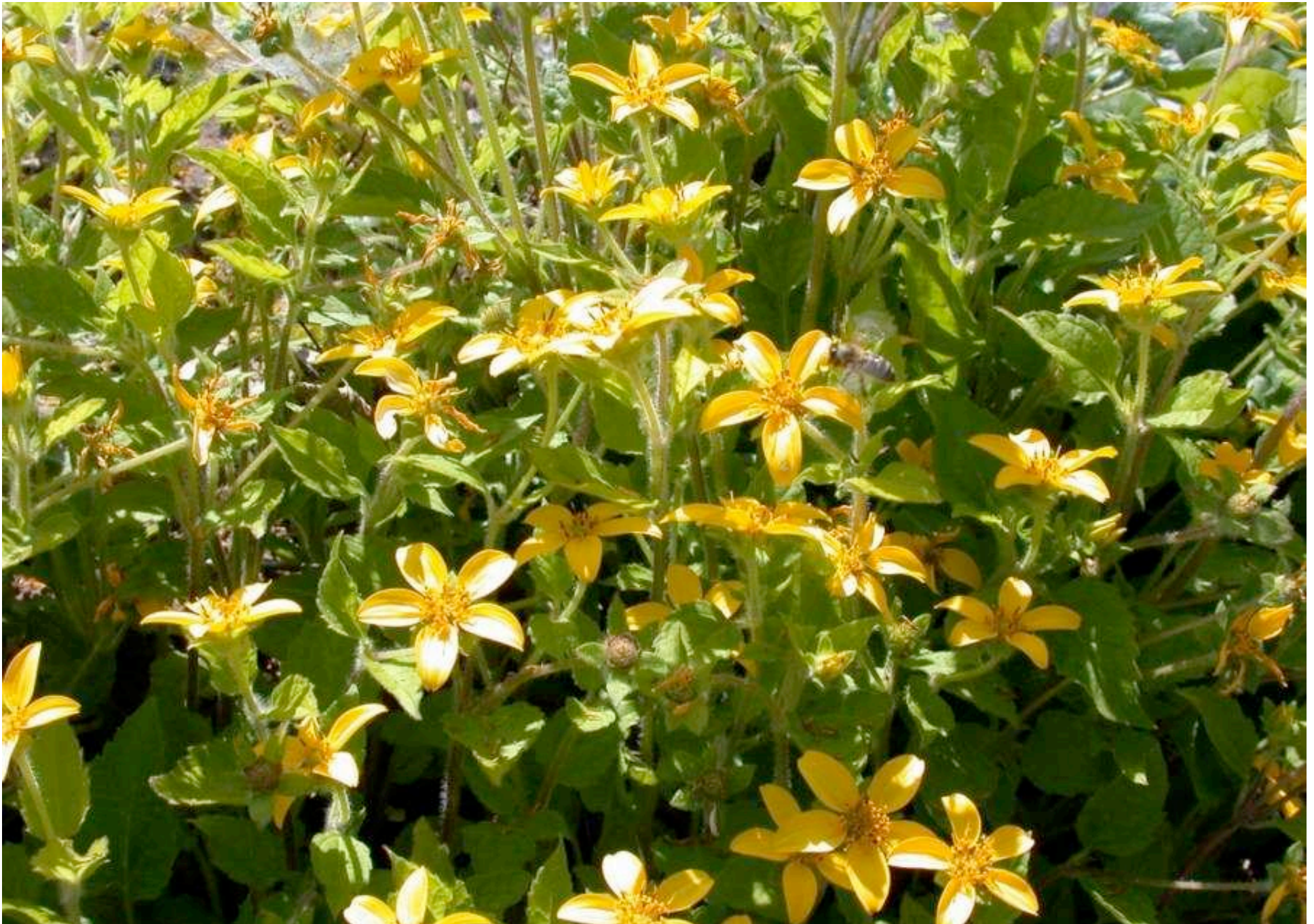
Chrysogonum virginianum, Goldkörbchen