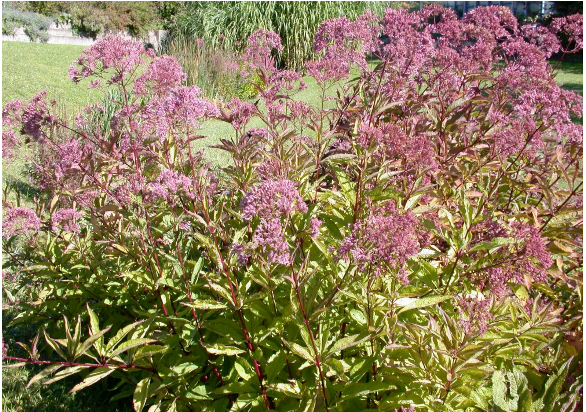
Eupatorium purpureum, Purpur-Wasserhanf