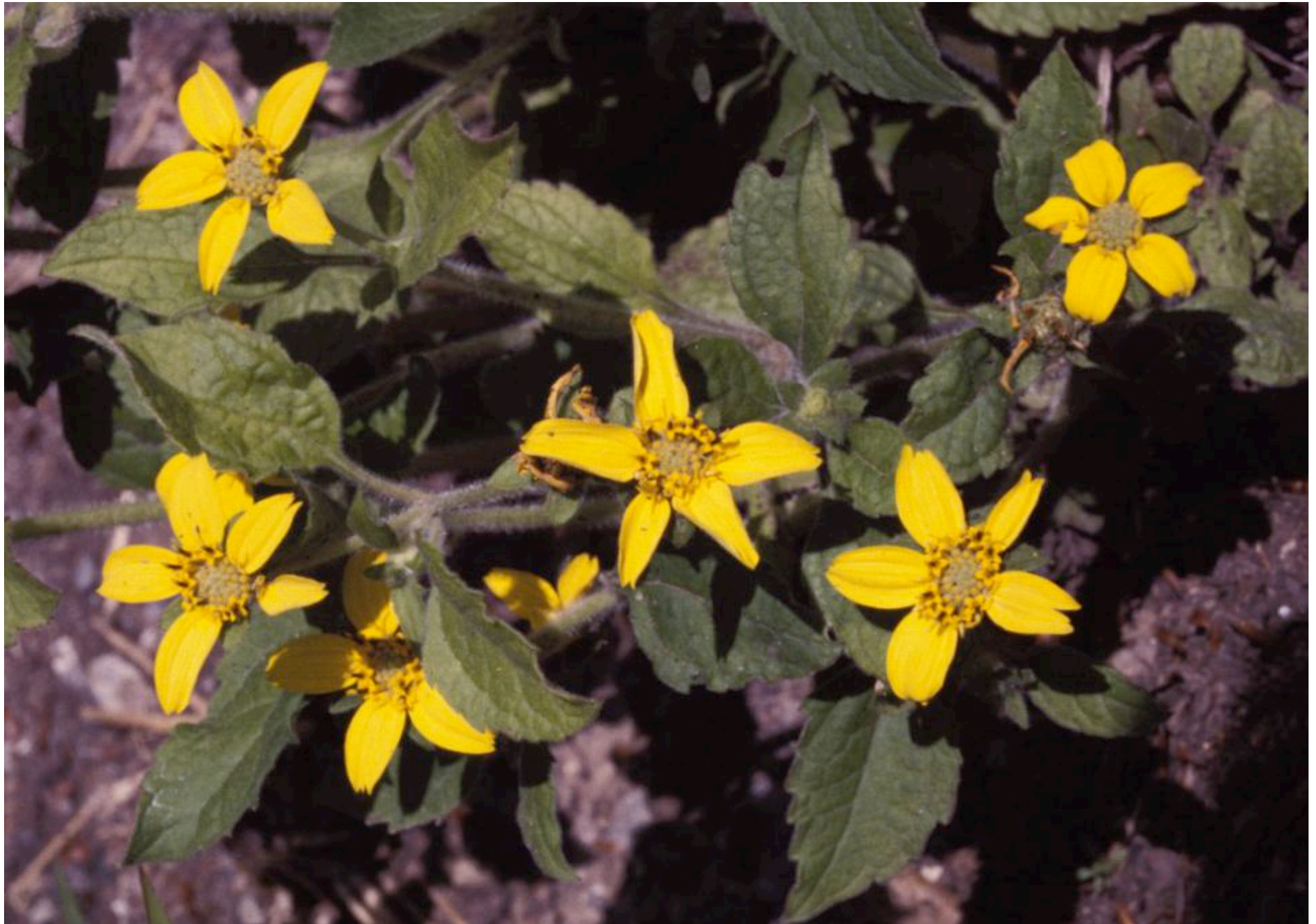
Chrysogonum virginianum, Goldkörbchen