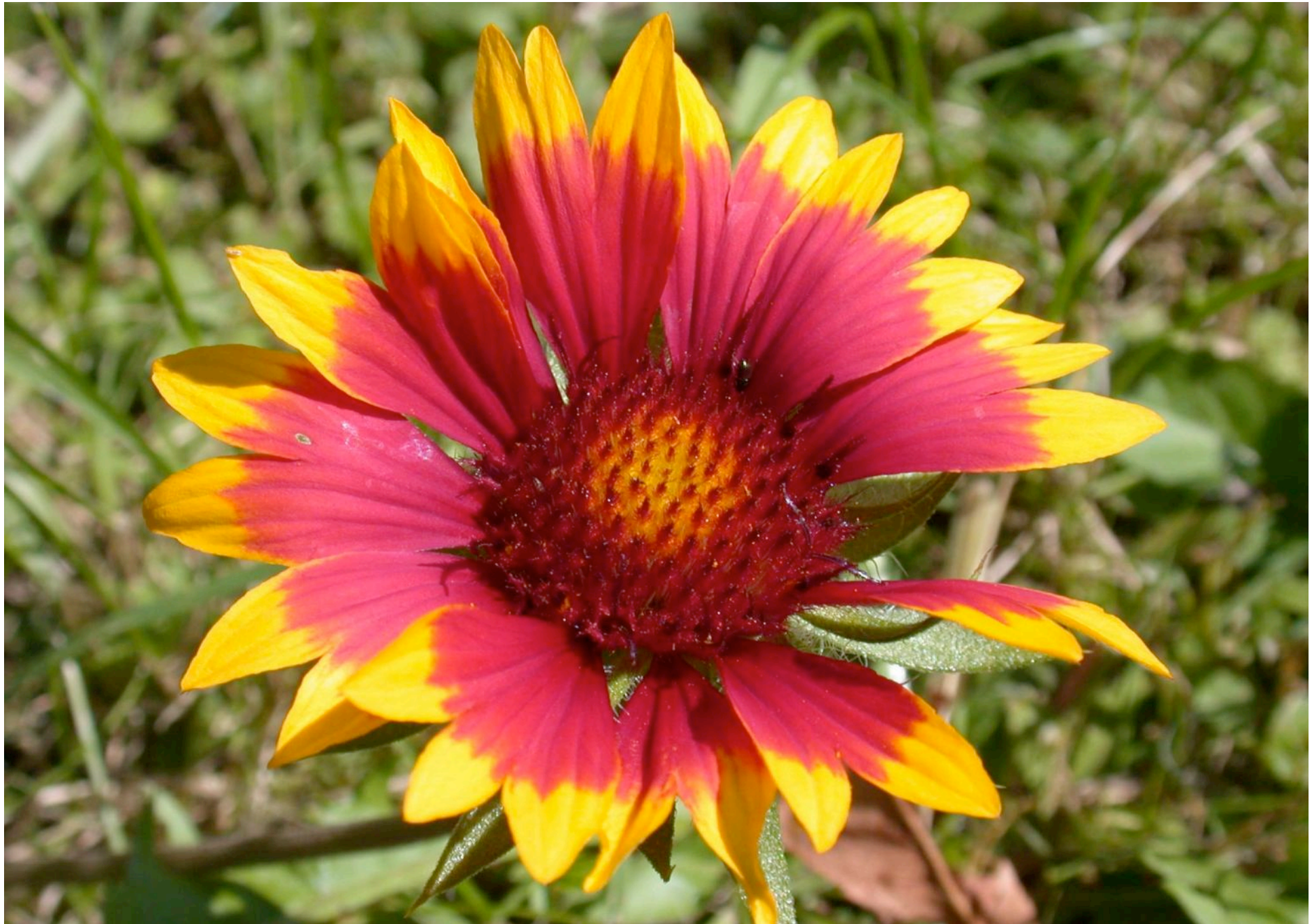
Gaillardia aristata, Kokardenblume