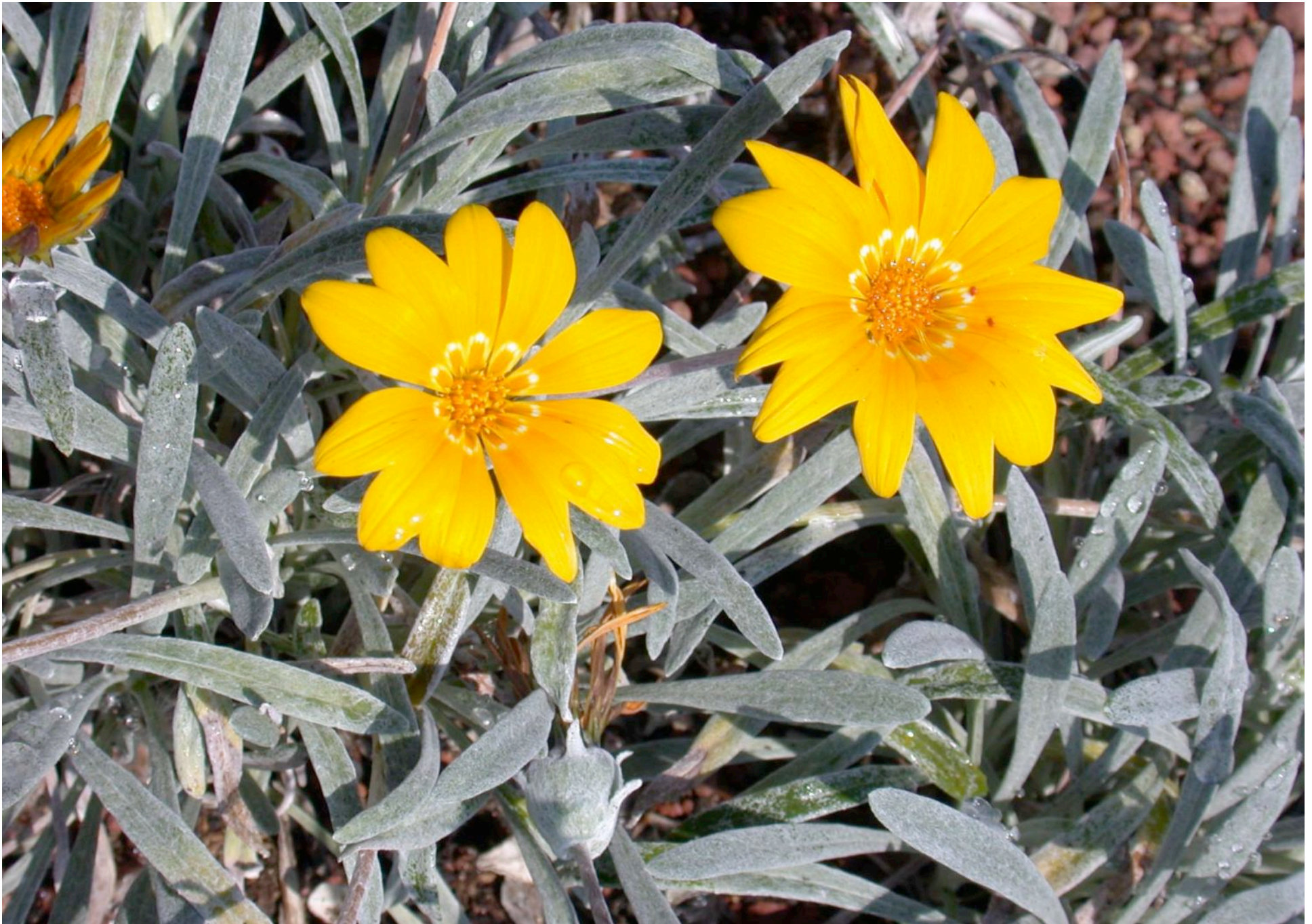
Gazania rigens „Goldgelb“