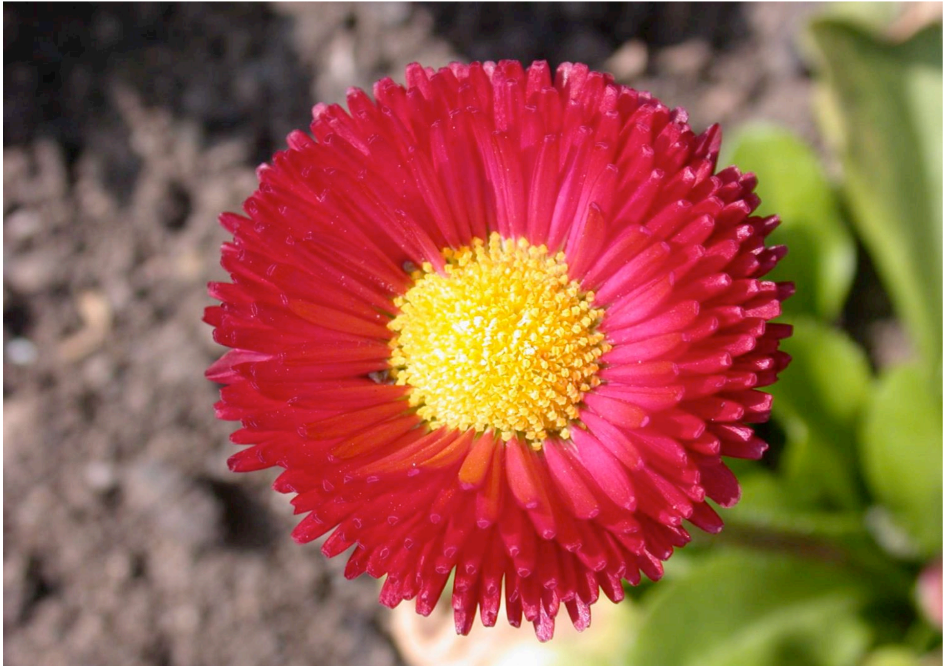
Bellis perennis Hybrid