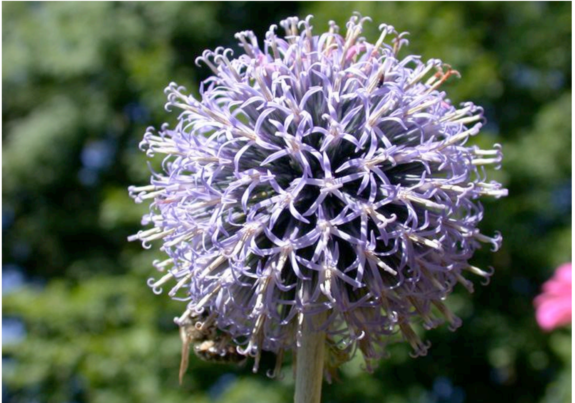
Kugeldistel, Echinops sphaerocephalus