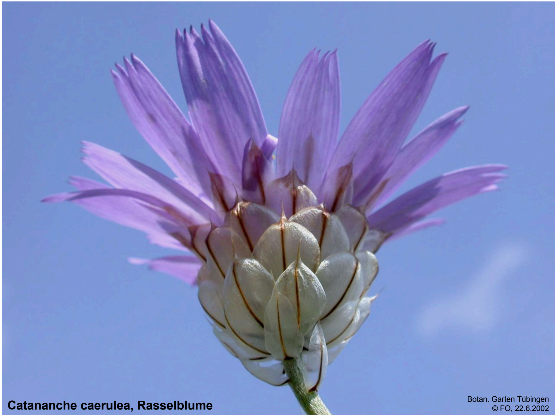
Catananche caerulea, Rasselblume