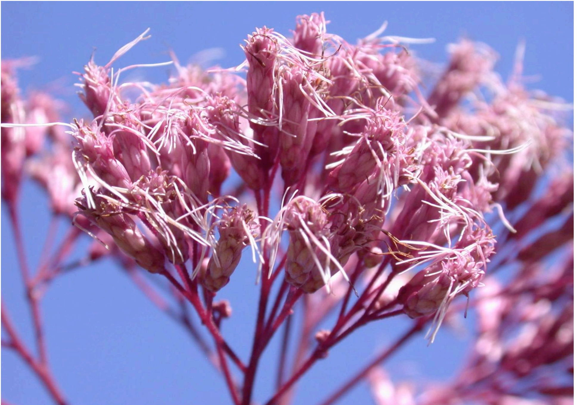
Eupatorium purpureum, Purpur-Wasserhanf