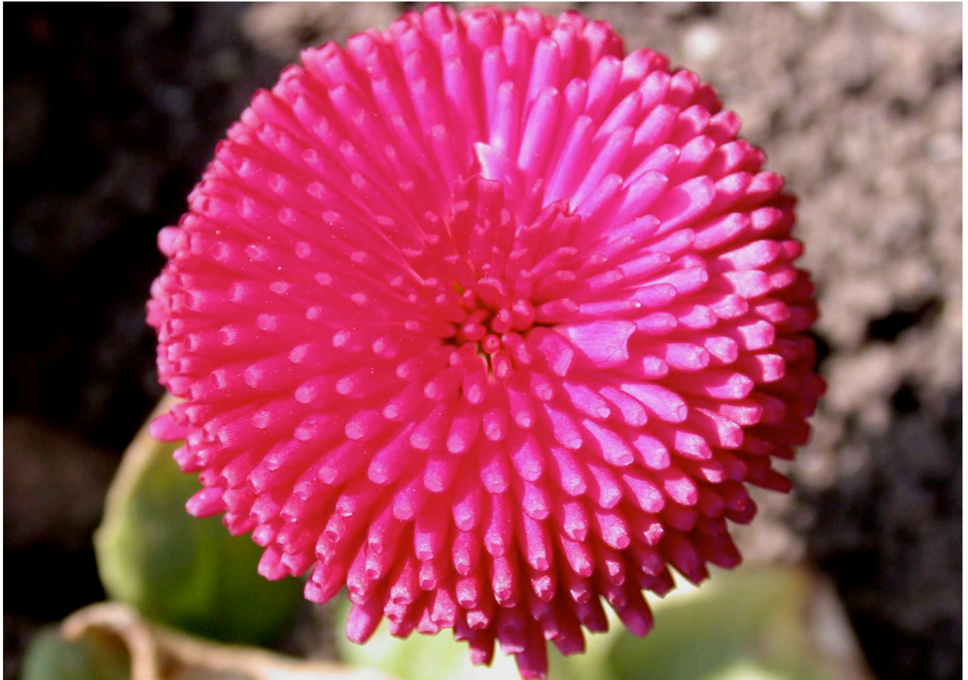
Bellis perennis Hybrid