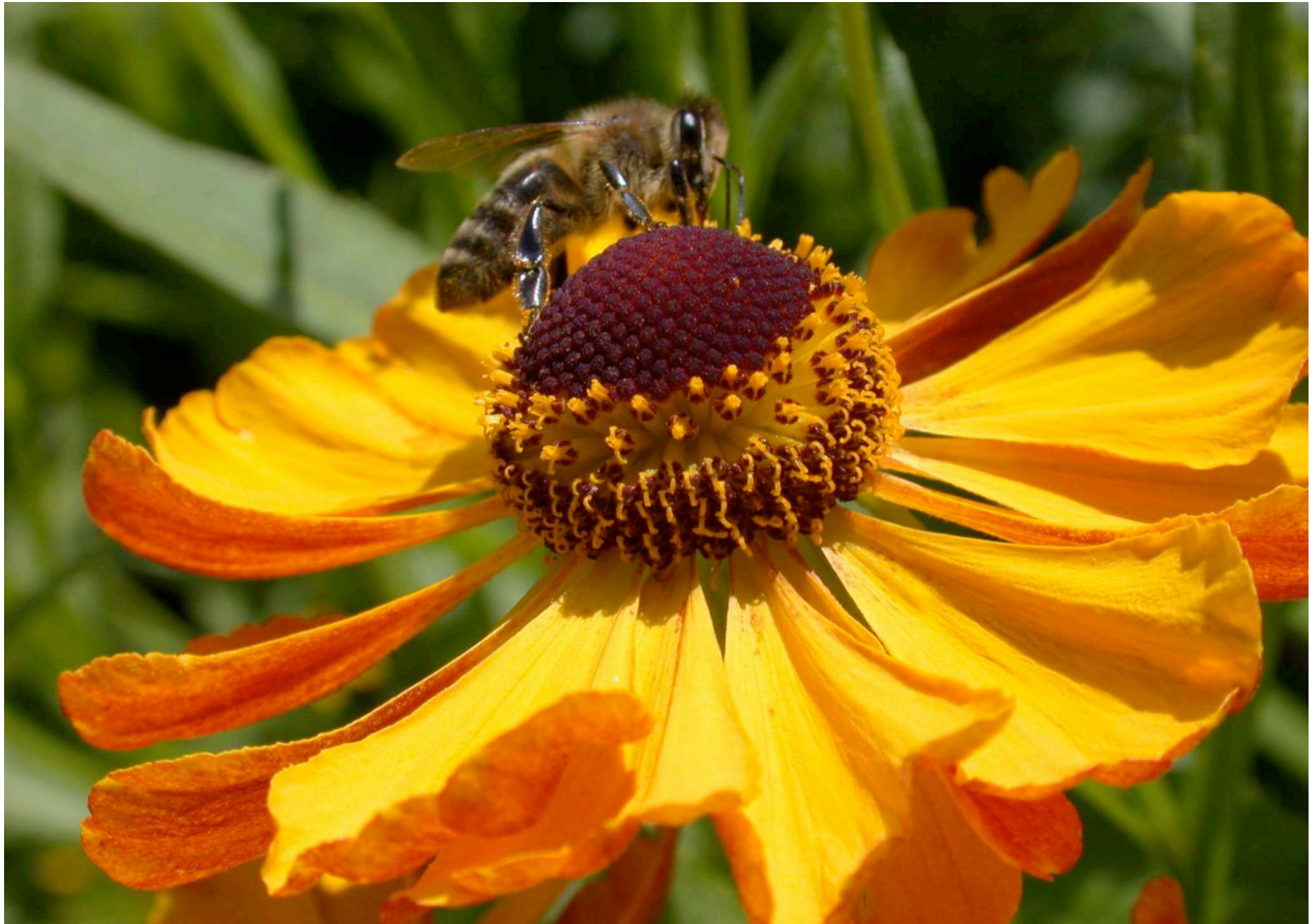
Helenium autumnale „Goldrausch“